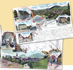
Vom Viehhändler zum Weinbauer

Zum Entspannen besuchen die Einersheimer die Gasthäuser und Heckenwirtschäften oder treffen sich bei Festen und Veranstaltungen. An Christi Himmelfahrt wird die Geschichte des Marktfleckens lebendig: Fliegende Händler bieten auf dem Käschblütenmarkt ihre Waren feil. Beim Festival der Weine im Juli präsentieren die Winzer die Früchte ihrer Arbeit. Und wenn im September vor dem Schloss und auf der Hegwiese die traditionelle Kirchweih gefeiert wird, zeigen sich die vielen Vereine von ihrer besten Seite. Schließlich wollen die starken und tüchtigen, konsequenten und geselligen Markt Einersheimer voll auf ihre Kosten kommen.