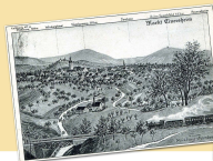
Von Rittern, Schenken und Grafen

Anhalten lohnt sich immer, denn es gibt hier noch viele weitere Sehenswürdigkeiten und interessante Freizeitangebote: Das „Wengertshäusla“, die „Förstersche Apotheke“ und das Alte Schulhaus, verschiedene Sport- und Spielanlagen und besonders das wunderschön angelegte Terrassenbad. Wanderfreunde genießen auf dem Steigerwald-Panoramaweg oder der „Speckfelder Runde“ mit ihren Infotafeln die herrliche Aussicht – und können anschließend gerne hier einkehren und verwelken.